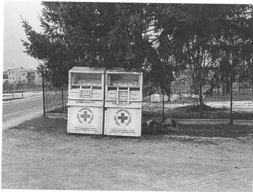
Fot. 3 - Lubasz, przy stadionie