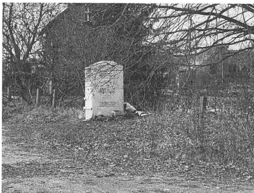
Fot. 2 - Goraj