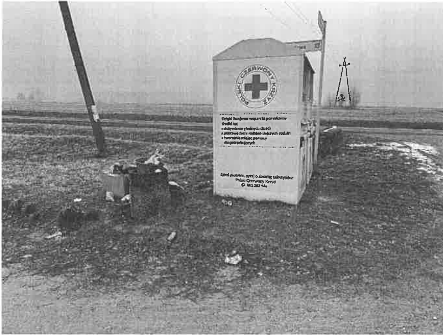
Fot 5. Lubasz, os. Gorajskie

Proszę o udzielenie odpowiedzi na niniejszą interpelację w ustawowym terminie.