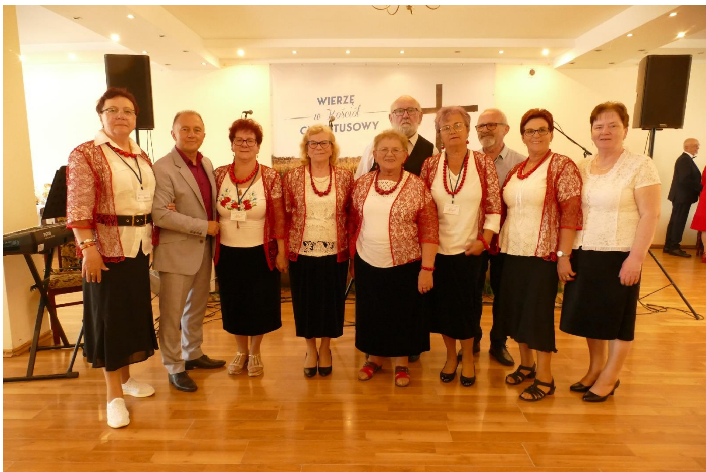
Na XIX Festiwalu Piosenki Seniorów – WIERZĘ W KOŚCIŁ CHRYSZTUSOWY w Szamotułach. (6 czerwca)