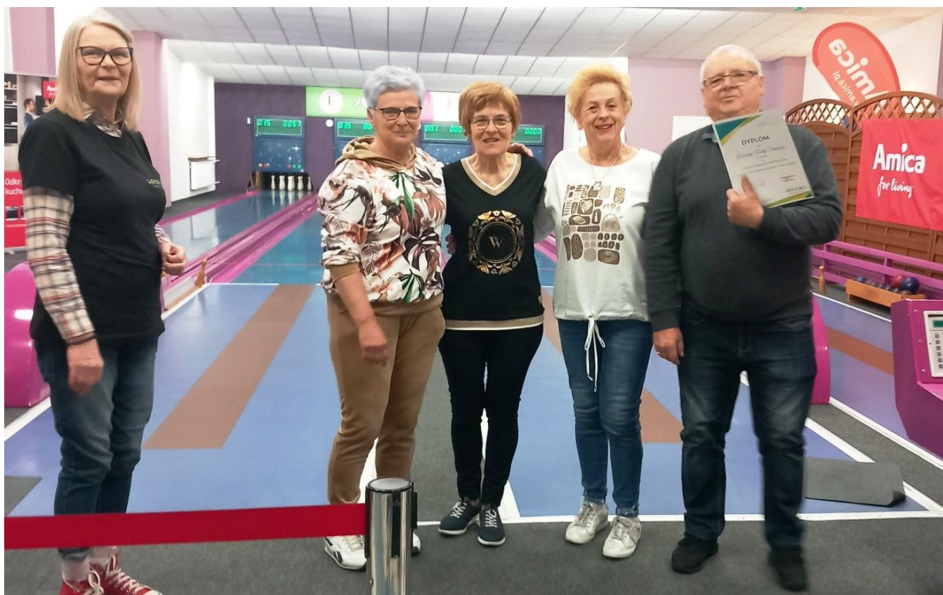
Lubaska reprezentacja z okolicznościowym dyplomem.

Na zaproszenie Wronieckiej Rady Seniorów delegacja naszej LRS 17 kwietnia 2023 roku brała udział w spotkaniu integracyjnym. we wronieckiej kręgielni. Spotkanie patronatem objął burmistrz Wroniek. Przyjechali przedstawiciele Obornickiej Rady Seniorów, Lubaskiej Rady Seniorów, Rady Seniorów z Tarnowa Podgórnego, Chodzieskiej Rady Seniorów, Gminnej Rady Seniorów w Krobi, Śremskiej Rady Seniorów oraz Seniorzy z Kaźmierza, którzy planują założenie rady