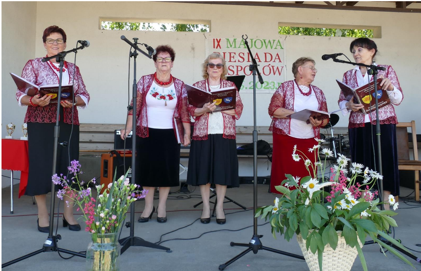
Na biesiadzie w Gościejowie (3 czerwca)