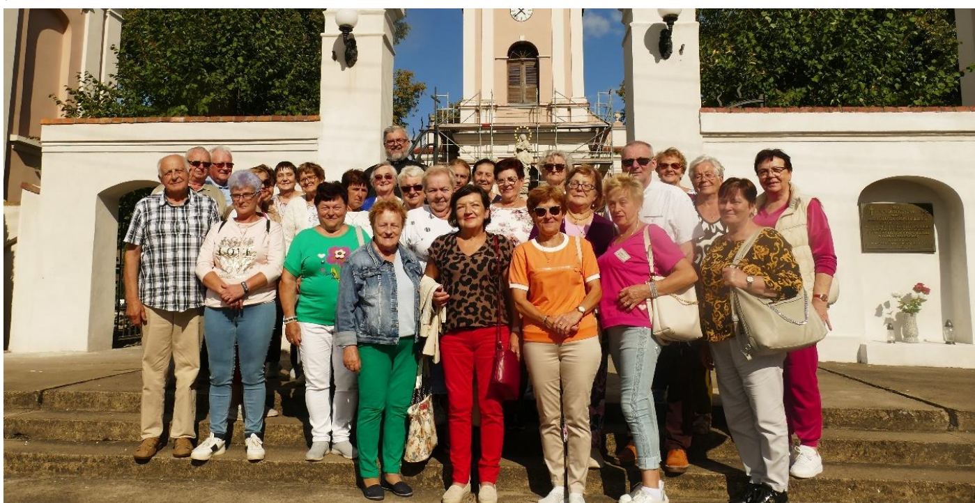
oraz przed kościołem w Kwilczu