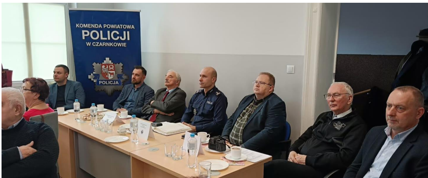
Grudzień 2023. Tradycyjne spotkanie opłatkowe. (18 grudnia 2023 roku)