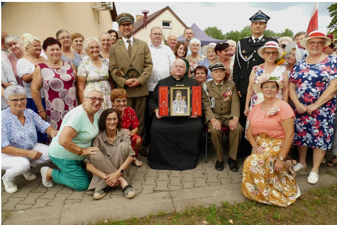
Pamiątkowa fotografia części uczestników i Gości.