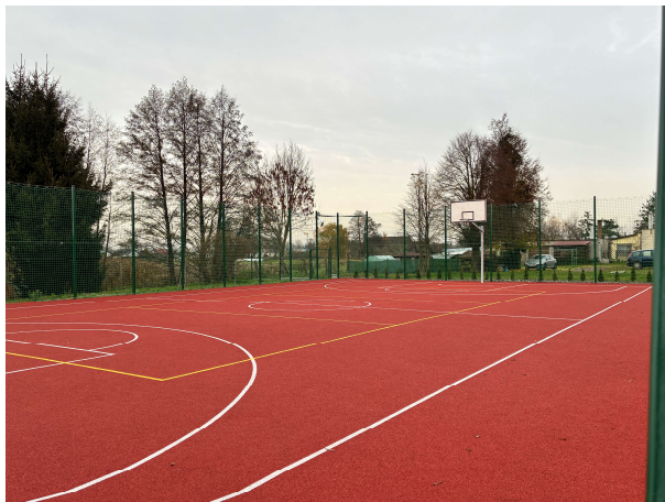
Boisko sportowe przy szkole