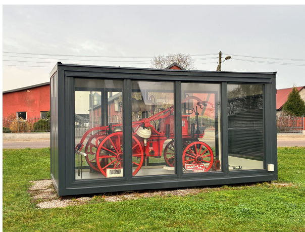
Zabytkowy sprzęt strażacki