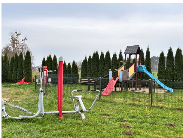
Plac zabaw i siłownia