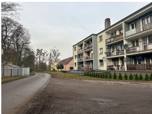
Droga wjazdowa do Centrum