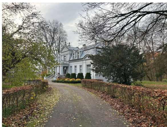
Palac i park dworski