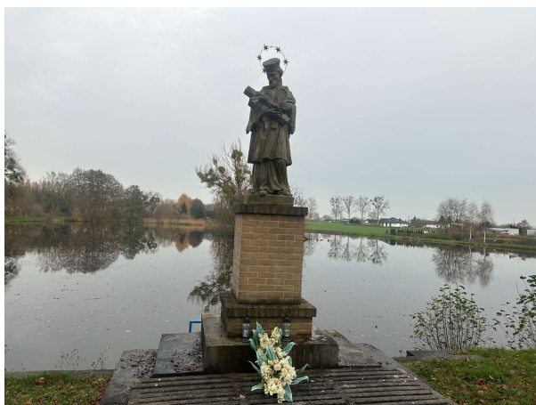
figura św. Jana Nepomucena nad stawem