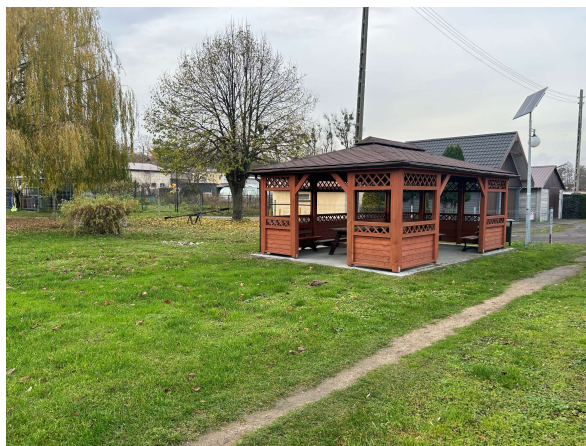
Wiata drewniana - miejsce spotkań