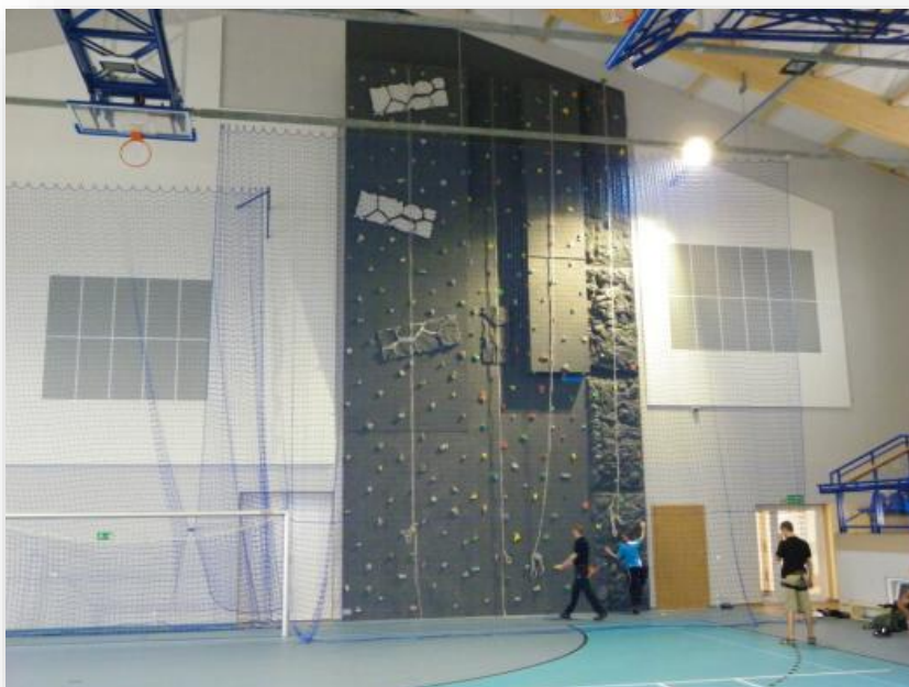
RYSUNEK 4. HALA WIDOWISKOWO-SPORTOWA W LUBASZU (2)