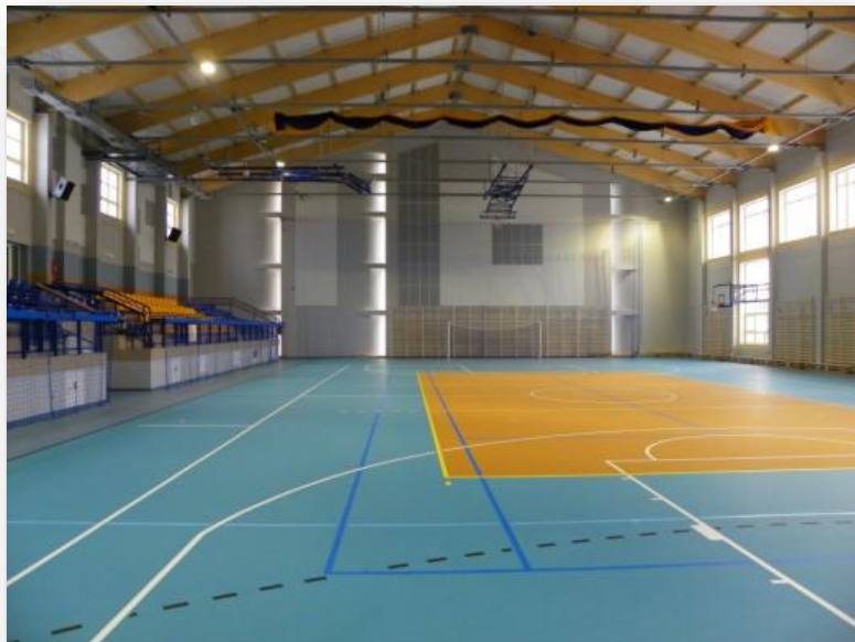
RYSUNEK 3. HALA WIDOWISKOWO-SPORTOWA W LUBASZU (1)

Hala oferuje możliwość organizacji imprez artystycznych: wystaw, konkursów, występów instrumentalno-wokalnych, itp.